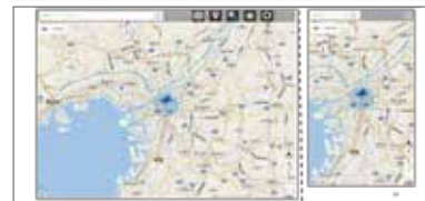
施設情報表示機能