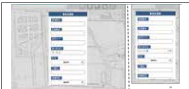
編集機能 (事故点情報登録)