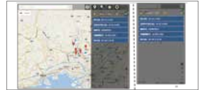
検索機能 (属性検索)