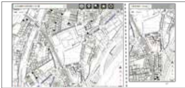
検索機能 (住所検索)