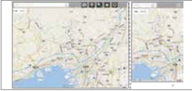
地図表示機能 (GoogleMap/地形図)