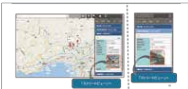
施設情報表示機能