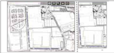
地図表示機能 (都市計画図)