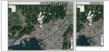
地図表示機能 (GoogleMap/航空写真)